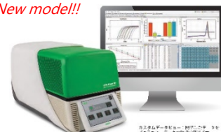
“CFX Opus 96”