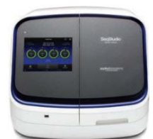
“SeqStudio Genetic Analyzer”