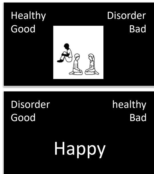
Fig. 1 IAT 課題の刺激図

で障害者に関するイラストを見ている際の脳活動データから開発したIAT課題による潜在的態度変数の予測可能性について検討することを目的とした。