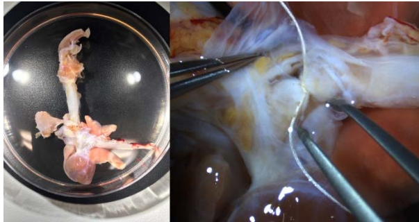
マーモセットの心臓と血管系（左）と下行大動脈に作成した TAC モデル（右）

ヤギの遺伝子型のいくつかは明らかになっているものの、体系立った環境にはなく、ヤギ自体が実験動物として遺伝的に系統立っていないため、個体間の比較は高いハードルがあることがわかった。今後はせん断応力がかかる部位（大動脈弓部）と、かかりにくい部位（頸動脈など）とで比較を行うことが望ましいと考えられる。