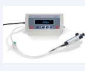
専用リークテスター