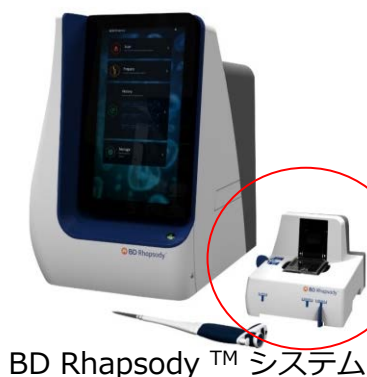
BD Rhapsody™ システム