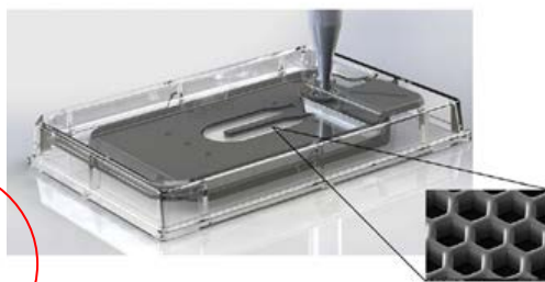
20万以上のマイクロウェル を持つ専用カートリッジ