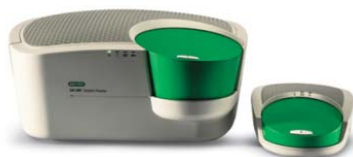
QX200™ Droplet Digital™ PCR システム